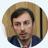
سعید منجم زاده

مدیرکل سیاست گذاری معاونت علمی، فناوری و اقتصاد دانش بنیان ریاست جمهوری